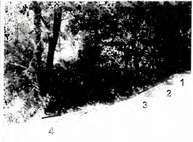
Fotografía 4.- Afectación de la base del tallo de cuatro árboles Buddleia cordata (tepozan)