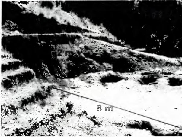
Fotografía 1.- Primer terraceo y talud