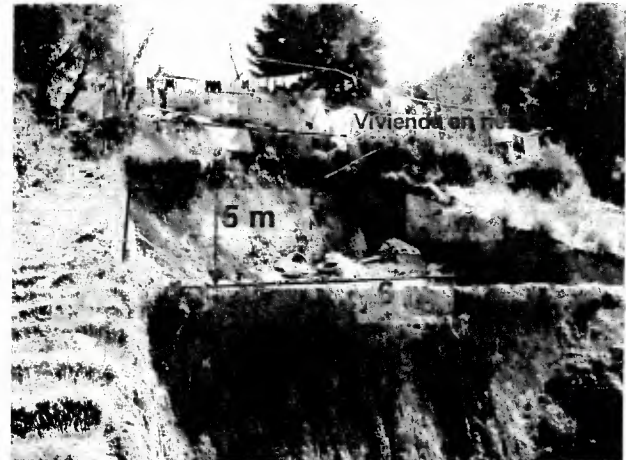
Fotografía 2.- Segundo terraceo y talud.