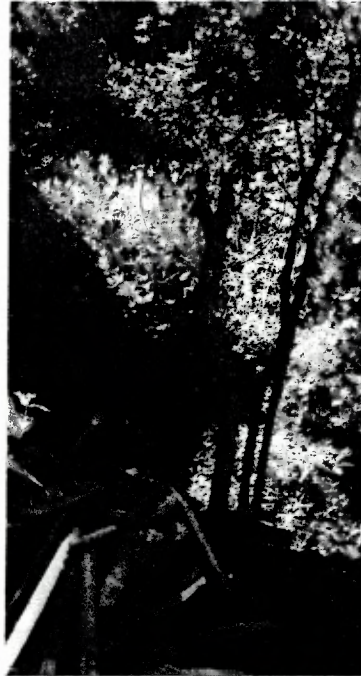
Fotografía 5.- Desmoche practicado al individuo arbóreo de la especie Arbutus jalapensis (madroño) no presenta rebrotes.