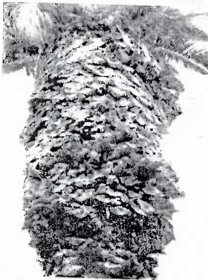
Se puede apreciar que la poda no fue homogénea ya que se dejaron parte de las hojas, lo que ocasiona que con el viento se balancee más.