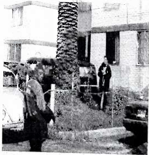
Se aprecia el espacio (jardinera) en donde está plantada, asimismo se observa la cercanía con el inmueble y cajones del estacionamiento, los cuales no son afectados