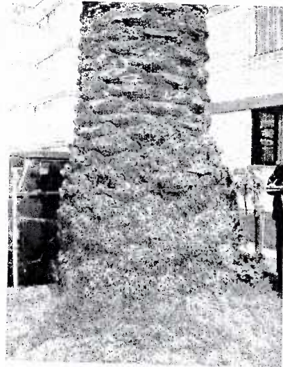
Las raíces del árbol se encuentran en buen estado y con buen anclaje

Nota: Este dictamen no constituye autorización por parte de la PAOT para realizar la acción de manejo recomendada.