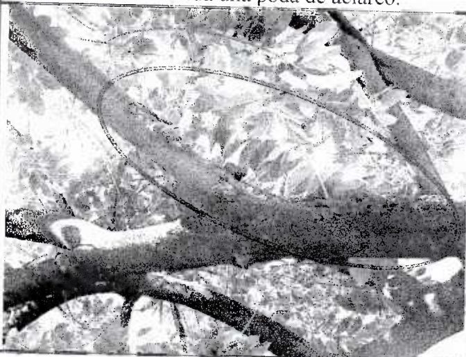
Se observa el daño mecánico en algunas de las ramas.