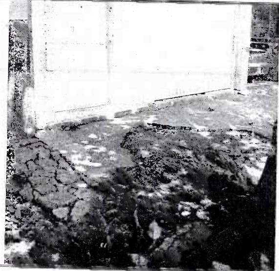
Se aprecia la afectación de la infraestructura urbana (banqueta).