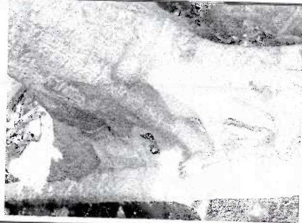
Se aprecia la afectación de la infraestructura urbana (guarnición).

Nota: Este dictamen no constituye autorización por parte de la PAOT para realizar la acción de manejo recomendada.