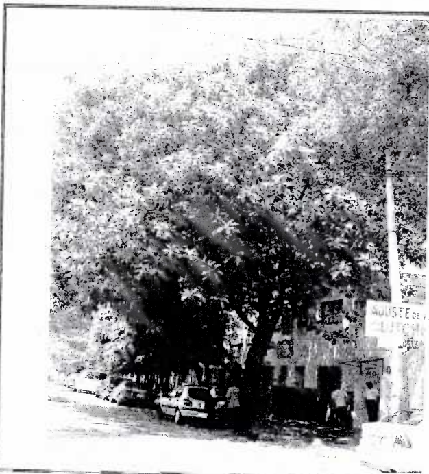
En esta imagen se observa la condición física del individuo, altura 10.5 metros con una fronda de 8 metros. Se recomienda una poda de aclareo.