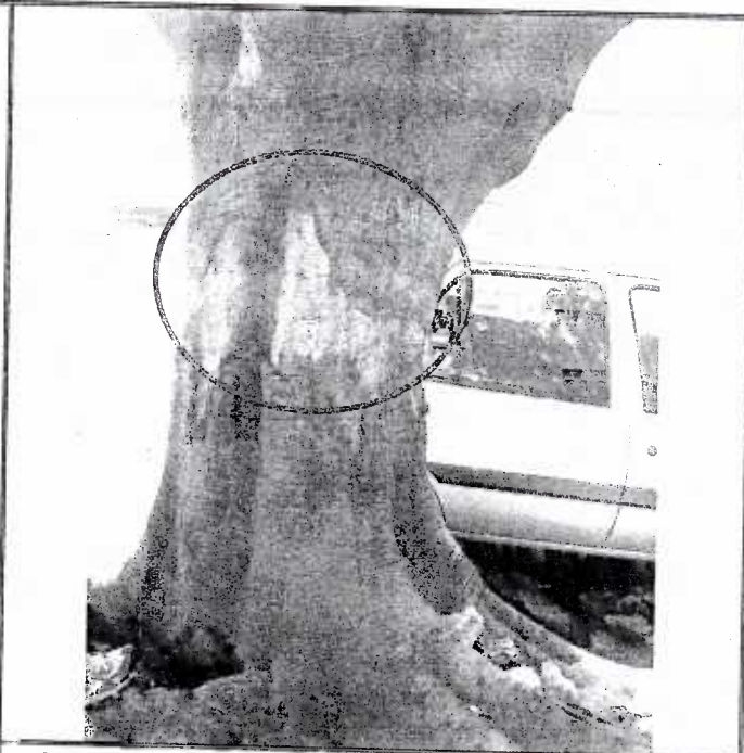
Se observa el daño mecánico de 40 centímetros del fuste.