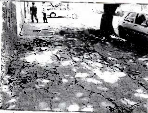
Se observa la afectación del inmueble, se recomienda la ampliación del cajete de 1.50 metros a partir del centro del árbol en dirección norte, sur y poniente.